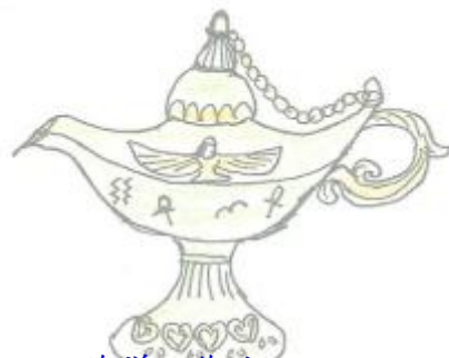
回海洋工作站 阿拉丁神燈