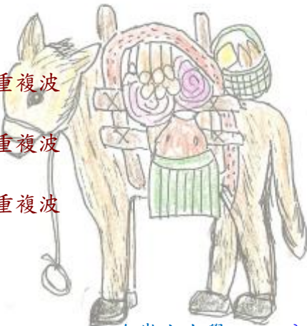
回海岸水力學 回分類索引 載滿貨品的驢子